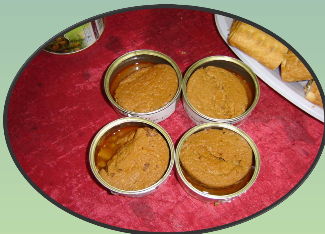
فیش پیست (خمیر آماده مصرف ماهی)